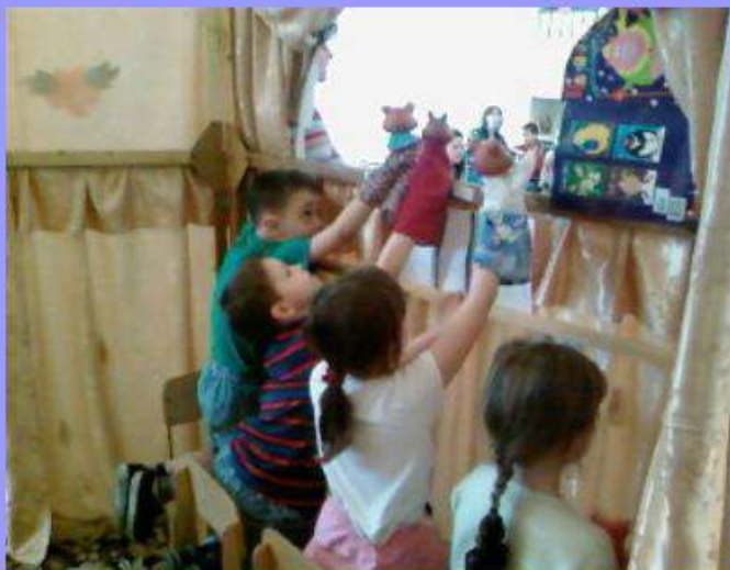
Первые шаги в театре. Сказка «Два жадных медвежонка»

Театральная деятельность является интегрированной, включает в себя и выразительное движение, и пение, и танец, и игру, дает широкие возможности для активности детей, пробуждения фантазии