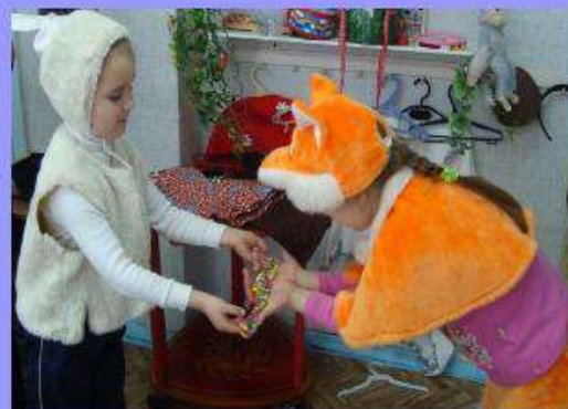
Перевоплощение помогает ребенку справиться с робостью, неуверенностью Игра «Узнай героя»