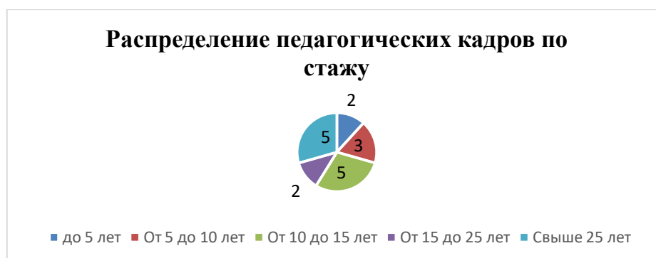
Диаграмма распределения педагогических кадров по стажу