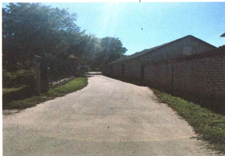
Фото подхода к зданию